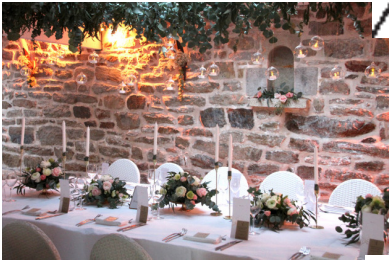
Salle de danse 120m 2