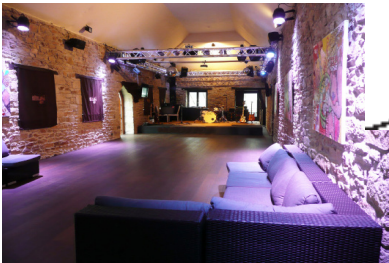
Salle de danse 120m 2